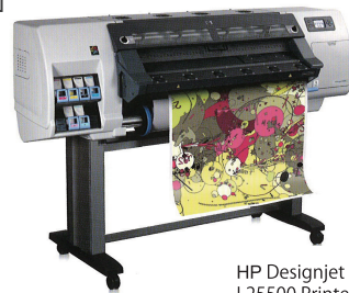
HP Designjet L25500 Printer